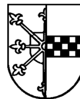
Wappen der ehemaligen Stadt Wattenscheid