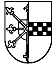
Wappen der ehemaligen Stadt Wattenscheid

Pestalozzi-Schule • Graf-Adolf-Str. 40 • 44866 Bochum